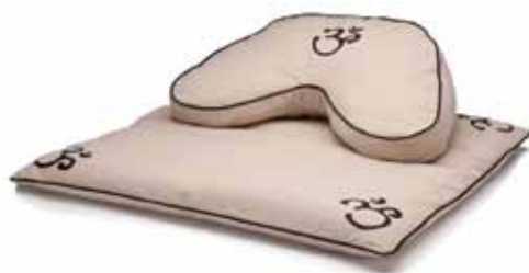
Duo ZABUTON et ZAFU pour la méditation

le large de coton 35 po X 28 po X 4 po épais