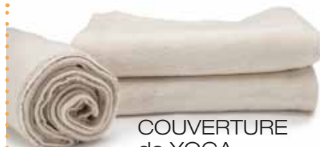
COUVERTURE de YOGA

Le court 12 po long X 5 po diamètre Les longs 24 po long X 4,5 po diamètre 24 po long X 6 po diamètre