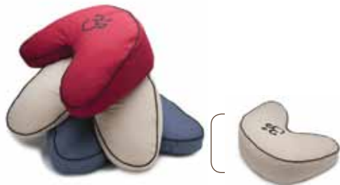
ZAFU en V

hauteur: 7 po inclinaison: de 2 po à 7 po